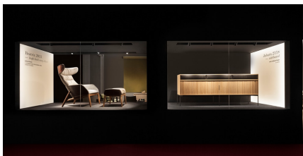
2018 プロダクトコンセプトを訴求したショーケースを 思わせるようなファサードデザイン 「TOKONOMA」の登場