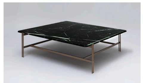
GT TABLE (DESIGN : SHINSAKU MIYAMOTO)

対角に交差する脚の構成が、完璧を超えた“ゆらぎの均衡”を描き出し、空間に呼吸と静かな動きをもたらします。石の重さと空気の軽やかさが一つになったような、緊張と静けさが共に息づく美しさが流れています。