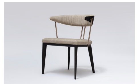
VESPER (DESIGN : ATELIER D.Q.)

“Well-balanced”（ウェル・バランス）＝ “ほどよい均衡を保つ” という感覚的な要素を大事にしています。脚部の全体に流れるやさしい曲線とバックレストを支えるスチール製の細くて丸い四つの柱が、微妙なウェル・バランスを保ち、身体をやさしく受け止めるような座り心地を生み出しています。