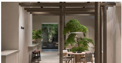
2024 “NEW SUSTAINABLE VALUE” のコンセプトのも と、柔らかに視界をファサードと爽やかな緑。自 然との調和を意識した従来とは趣の異なるブース デザインで新境地へ