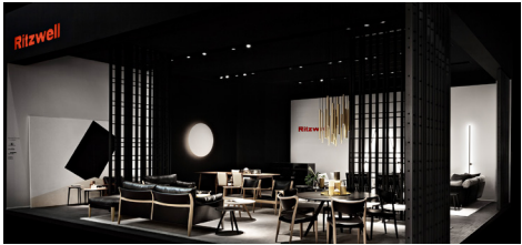
2016 ミラノサローネ史上初 アジアのブランドとして Hall-5 への出展

この年に初めてイタリア人チームとコラボレーションをしたブースデザインは、「BLACK & WHITE」を基調に、静謐な美しさを持つ「日本人の精神性」を表現し、世界的な評価を確立しました。そして、コロナ禍での開催となった 2022 年には、「職人の手しごと」を目の前で見ることのできる実演を実施し、以降リッツウェルの定番のプレゼンテーションとして認知され、昨年のミラノサローネ 2025 には、過去最多の 15,000 人の来場数を記録しました。 リッツウェルならではの確かな家具作りと、そこから生まれる美しく心地よい暮らしへの想いは、これらのプレゼンテーションを通して、世界中に広がりをみせています。