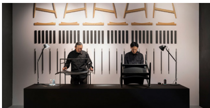
2022 創業 30 周年を記念して企画された特別仕様の RIVAGE イージーチェアと IBIZA FORTE イー ジーチェアの製作実演が大きな話題を呼ぶ